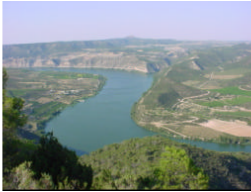
zona del paso del Ebro por la 42 Dvon Republicana