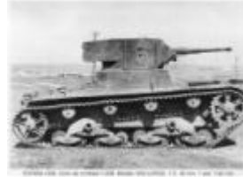
dos de los modelos de carros de combate utilizados en el asalto de los Auts