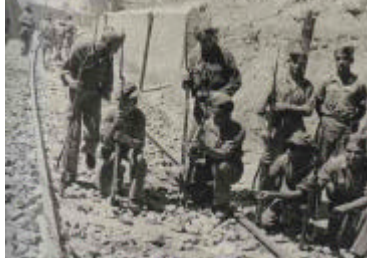
las fuerzas republicanas llegan hasta los tuneles de la vía ferrea, inmediatos a Fayon

Después de la acción del día 1º de agosto y conservando la primera organización dada en sus primeras horas, se perfeccionó la línea alcanzada, se acoplaron Mandos y sobre todo se organizaron los Servicios . Ello había permitido resistir totalmente el decidido propósito del enemigo de cortar la comunicación con Fayón y su acción contraofensiva del día 3 ser totalmente rechazada.