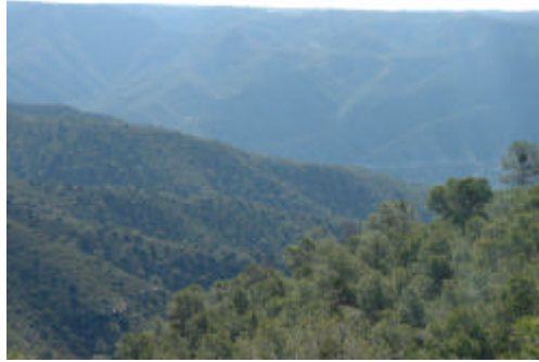
barrancos de Valdurrera, al fondo sierra de Almatret

Al amparo de la 1ª Agrupación y una vez ocupada la cota 423, la 3ª Agrupación emprendió la marcha desde la región de los Auts, hasta ocupar la línea 295 – 277 – 258.